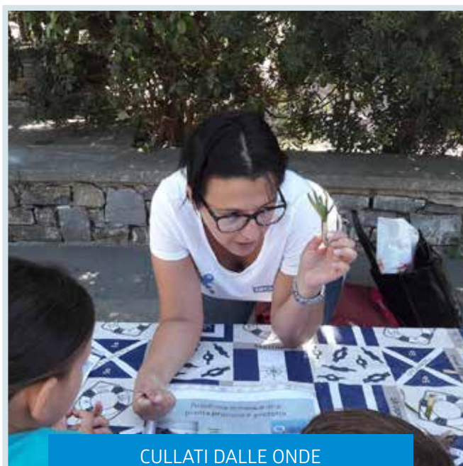
CULLATI DALLE ONDE LABORATORI

N. B. I laboratori "Il Mare in classe sul web" e la Visita alla Tonnarella di Camogli hanno tariffe differenti da quelle sopra indicate. Per i laboratori realizzati fuori della Provincia di Genova si richiede un contributo per le spese di viaggio da concordare